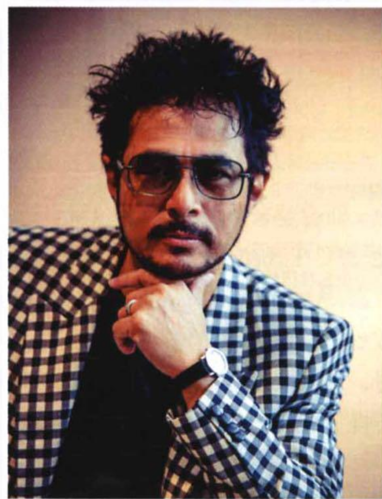
Peter Remedios 著名奢华地标酒店设计师， 曾获得“白金圈奖(Platinum Circle Award)”， 以表彰他在酒店设计方面的 终身卓越成就。